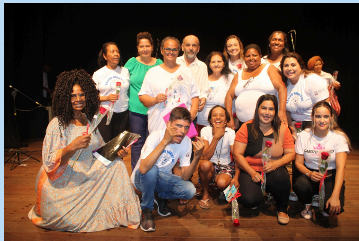
Evento de lançamento do Programa Saúde Mental Mais Perto de Você em 18/01/24 Parte da equipe e usuários da RAPS