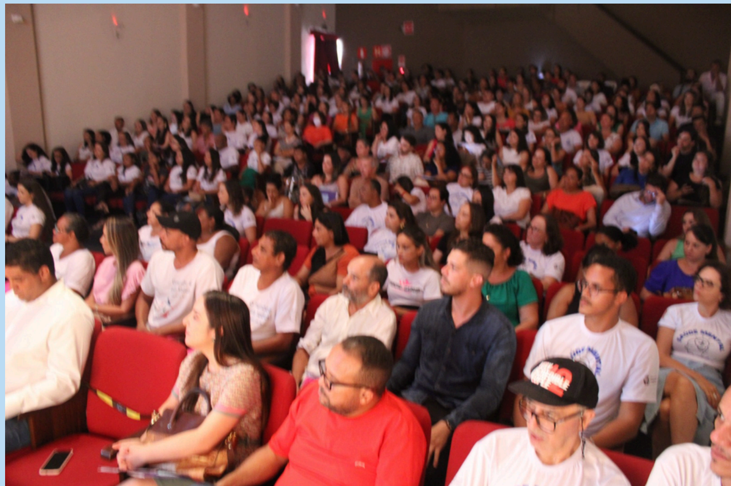
Evento de lançamento do Programa Saúde Mental Mais Perto de Você em 18/01/24