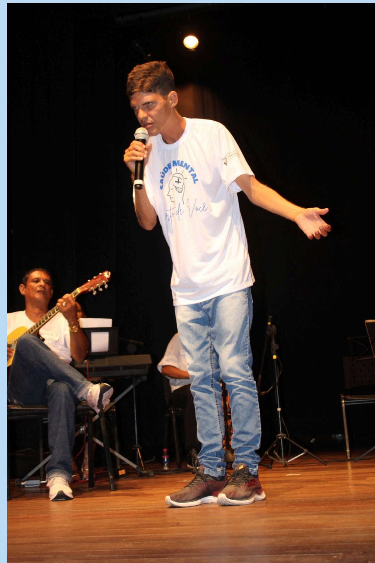
Evento de lançamento do Programa Saúde Mental Mais Perto de Você em 18/01/24 - usuário da RAPS